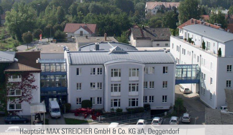
Hauptsitz MAX STREICHER GmbH & Co. KG aA, Deggendorf