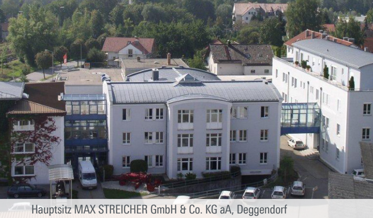
Hauptsitz MAX STREICHER GmbH & Co. KG aA, Deggendorf