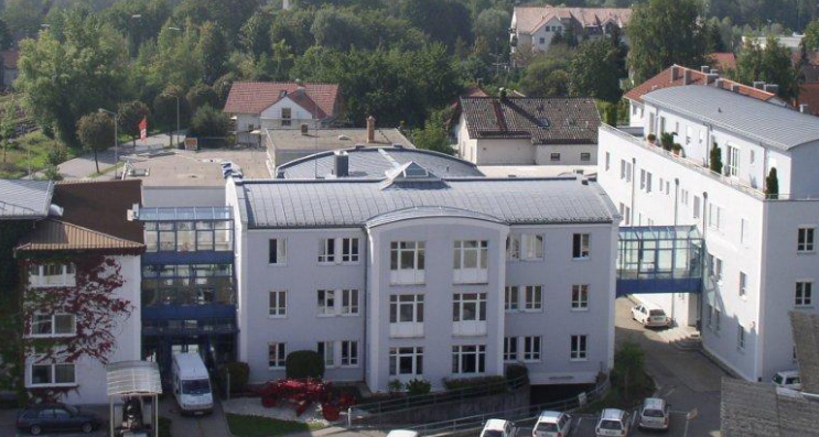
Hauptsitz MAX STREICHER GmbH & Co. KG aA, Deggendorf