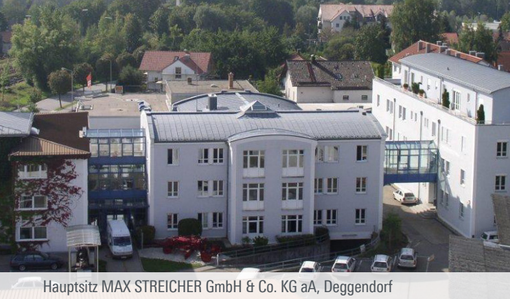
Hauptsitz MAX STREICHER GmbH & Co. KG aA, Deggendorf