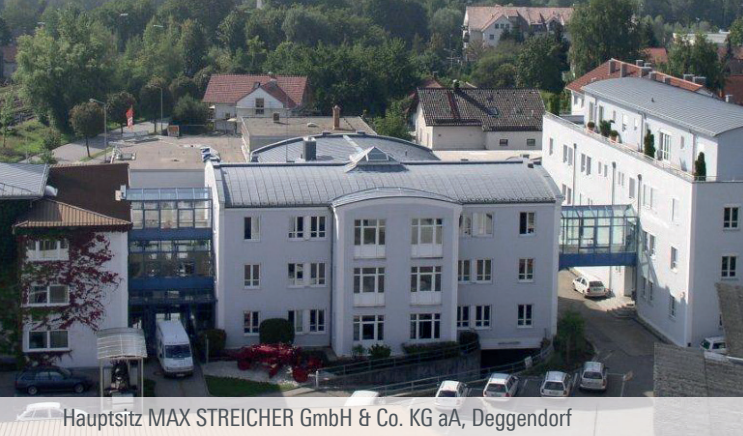
Hauptsitz MAX STREICHER GmbH & Co. KG aA, Deggendorf