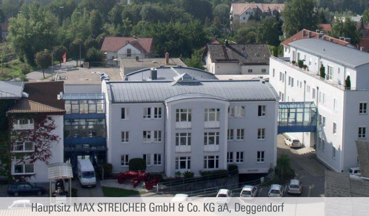
Hauptsitz MAX STREICHER GmbH & Co. KG aA, Deggendorf